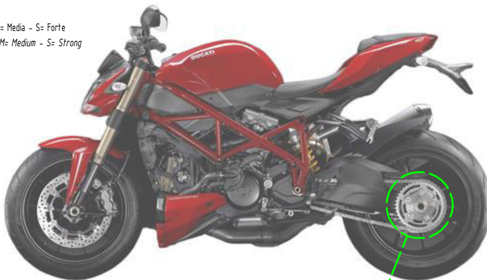
Immagine usata a fini esclusivamente illustrativi Image used for illustrative purposes only