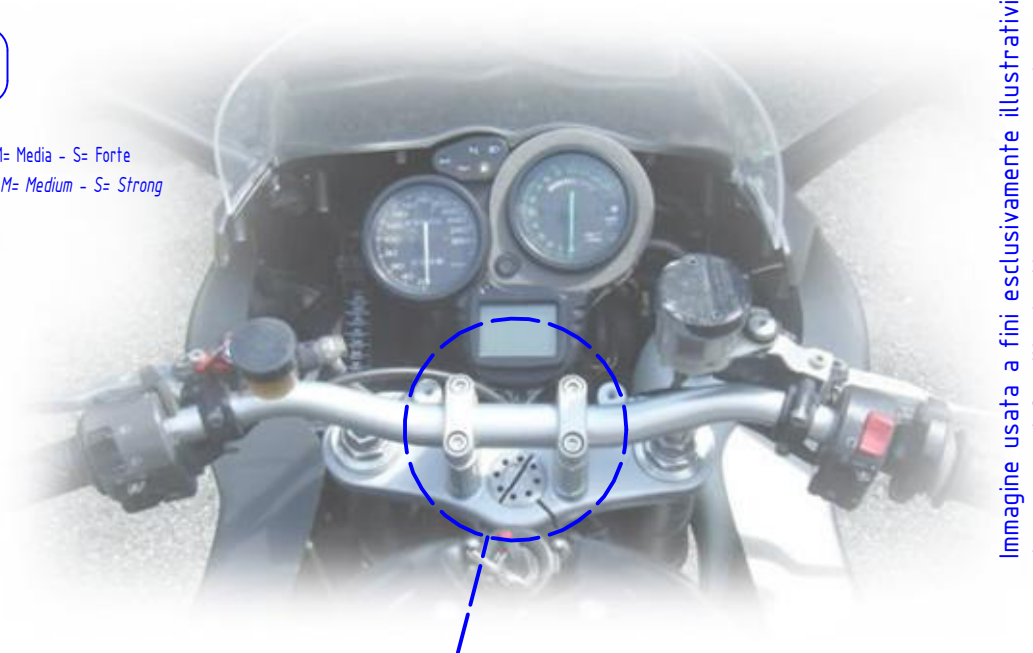
Immagine usata a fini esclusivamente illustrativi Image used for illustrative purposes only

Lubrificare ✓ / Non lubrificare ✗ Lubricate ✓ / Do not lubricate ✗