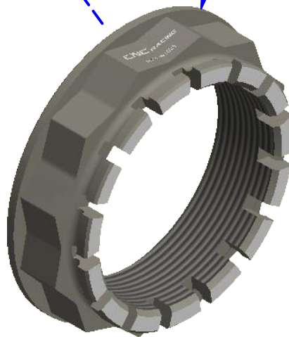
Immagine usata a fini esclusivamente illustrativi Image used for illustrative purposes only