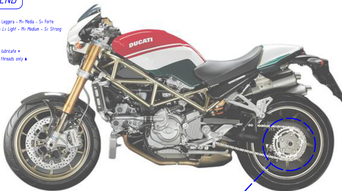
Immagine usata a fini esclusivamente illustrativi Image used for illustrative purposes only

Lubrificare ✓ / Lubricate ✓ Non lubrificare ✗ / Do not lubricate ✗ Solo primi filetti ◆ / First threads only ◆