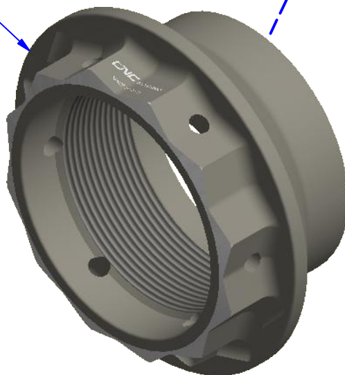
Immagine usata a fini esclusivamente illustrativi Image used for illustrative purposes only