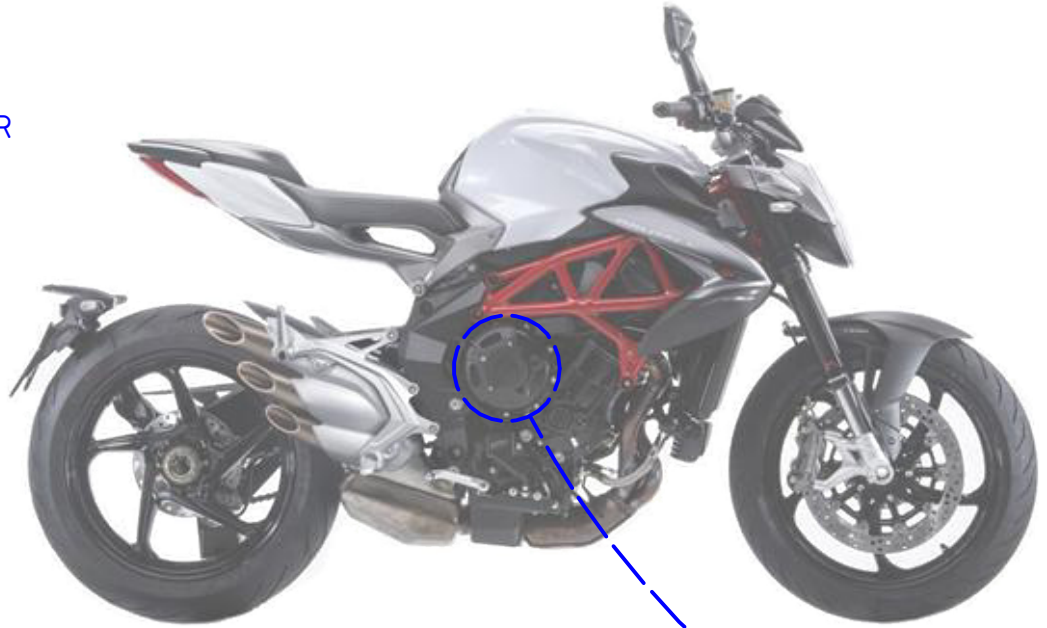
Immagine usata a fini esclusivamente illustrativi Image used for illustrative purposes only

PRIMA DI SERRARE LE VITI ASSICURARSI CHE IL PIATTELLINO SIA IN ADERENZA AL PACCO DISCHI FRIZIONE