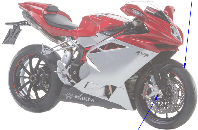
Immagine usata a fini esclusivamente illustrativi Image used for illustrative purposes only